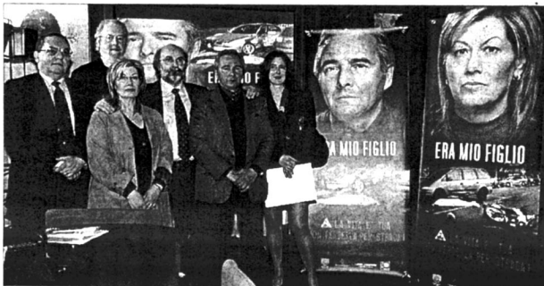
La conferenza stampa | partecipanti alla presentazione e sullo sfondo le immagini choc

Anche questo anno dunque sono previsti interventi specifici rivolti alla prevenzione e repressione della